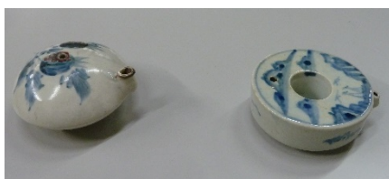
←小見山さんのコレクションの一部

安宅英一氏のコレクションを住友銀行の主導の下に住友グループ大阪市文化振興基金に寄付。コレクションを収蔵・展示する大阪市立東洋陶磁美術館を中之島公園に建設した