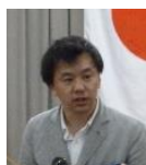
瀬野 会員増強退会防止

公共イメージは雑誌広報IT委員会と会報委員会の二つの委員会で構成をされています。公共イメージ全体では、会長方針に基づいて丸岡ロータリークラブのSDGsの作成を計画しています。それに基づいて広報活動を行っていきます。また、会報で会員間の情報共有をしていきます。丸岡ロータリークラブSDGsの作成ということでまだ企画段階ですが、持続可能な達成目標なので、本年度だけで終わるものではなく中長期で達成可能な目標を作成できればと考えています。それから例年通りタイスタディツアー等寄附事業のメディアへのバックアップをします。また、会報の作成は、輪番制として取り組んでいきます。