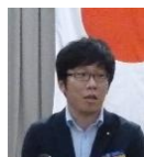
上屋敷 公共イメージ

親睦活動委員会では、若い世代が増えてクラブが活気づいた一方、ベテラン世代とのギャップが顕著になり、お互いのコミュニケーションが不足しがちです。ロータリークラブの良さをより多く理解しているベテラン世代と若い世代が例会や様々な活動を通じて、より活動が楽しくスムーズになるように委員会メンバーを中心に工夫していききたいと思います。懇親会の在り方もより多くのメンバーに来ていただけるように、また話し合う機会が増すように工夫していききたいと思います。