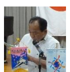
柿木クラブ管理運営理事

明朗な会計に努めて参りたいと思ひます。当クラブの予算は全部で850万程です。そのうち地区や国際ロータリーの本部からの分担金の負担が150万程度あります。また、約188万円が四大奉仕活動に充てられ、これはニコニコでの寄付金が原資です。会費と一緒にあらかじめ特別奉仕寄付金として、いただいておりますが、例会のたびにニコニコ箱は募ります。四大奉仕の委員会活動が一番華やかで一番のポイントだと思いますので、どうぞニコニコ箱への寄付をお願いいたします。