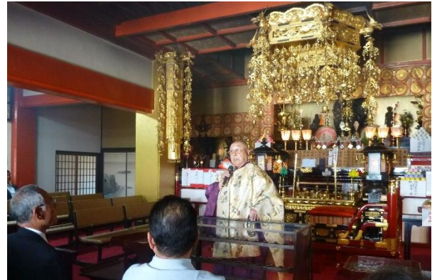
月間主管による護摩祈祷