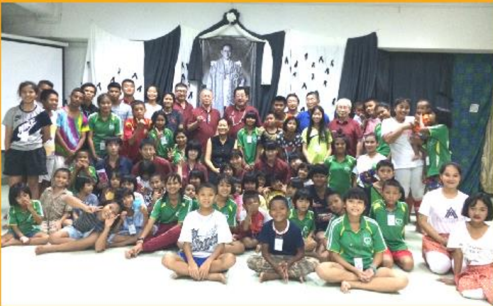
2017/6/4 スタディツアーinタイ パンターナムチャイ財団の子供たちと(バンガー県タクアバ)