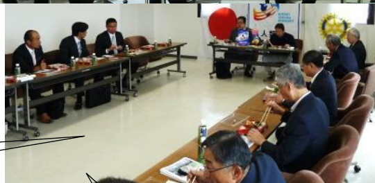
高棕コミセン 301号室にて例会前に昼食