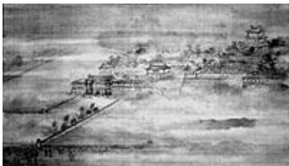
丸岡霞城御吉祥之図