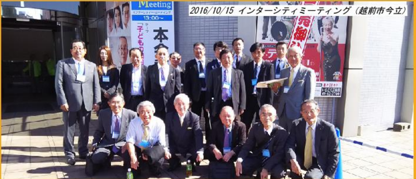
2016/10/15 インターシティミーティング (越前市今立)