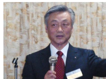
閉会のご挨拶 金会長エトより