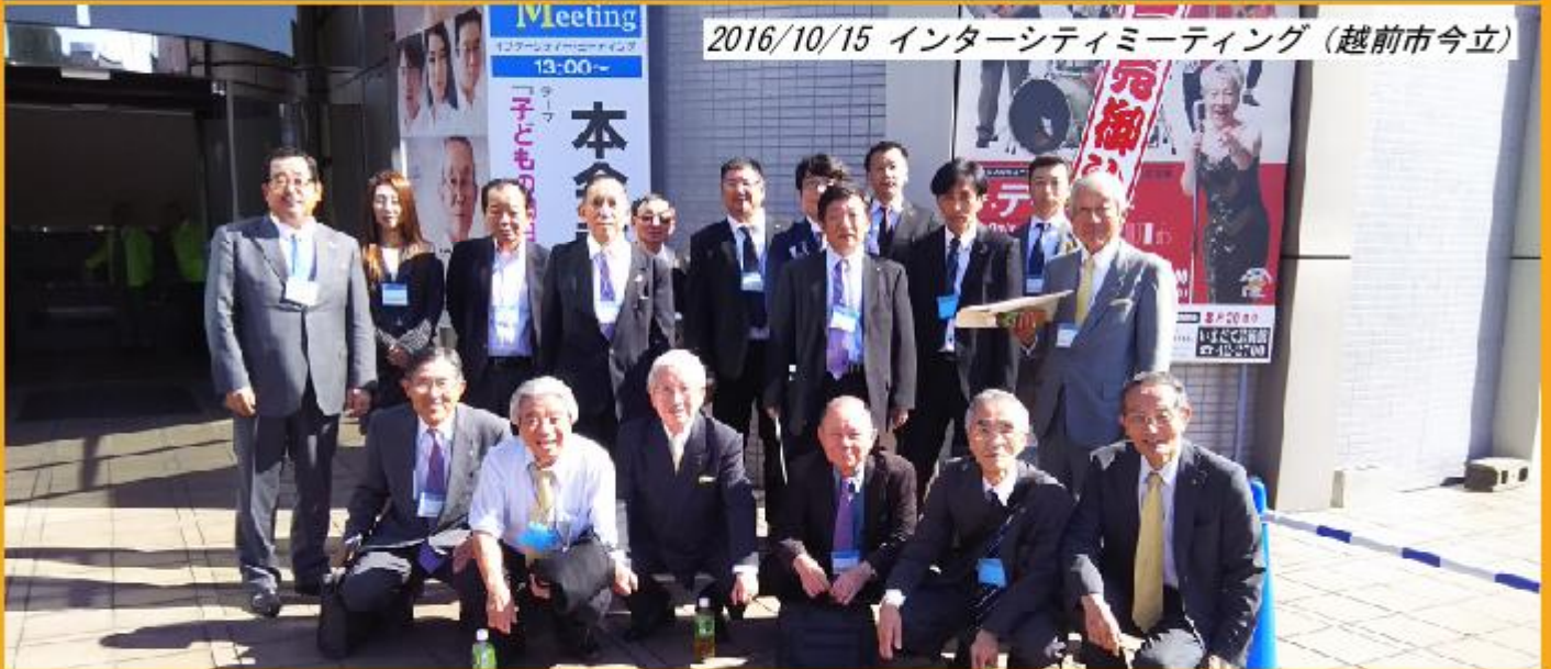
2016/10/15 インターシティミーティング (越前市今立)